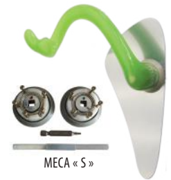
MECA « S »

- Produktpalette ULNA SILVER (oder ULNA GOLD nur auf Bestellung) aus Aluminium, nicht verstellbar :