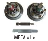
MECA « I »

- Palette ULNA SENSIAL aus Polypropylen, nicht einstellbar :